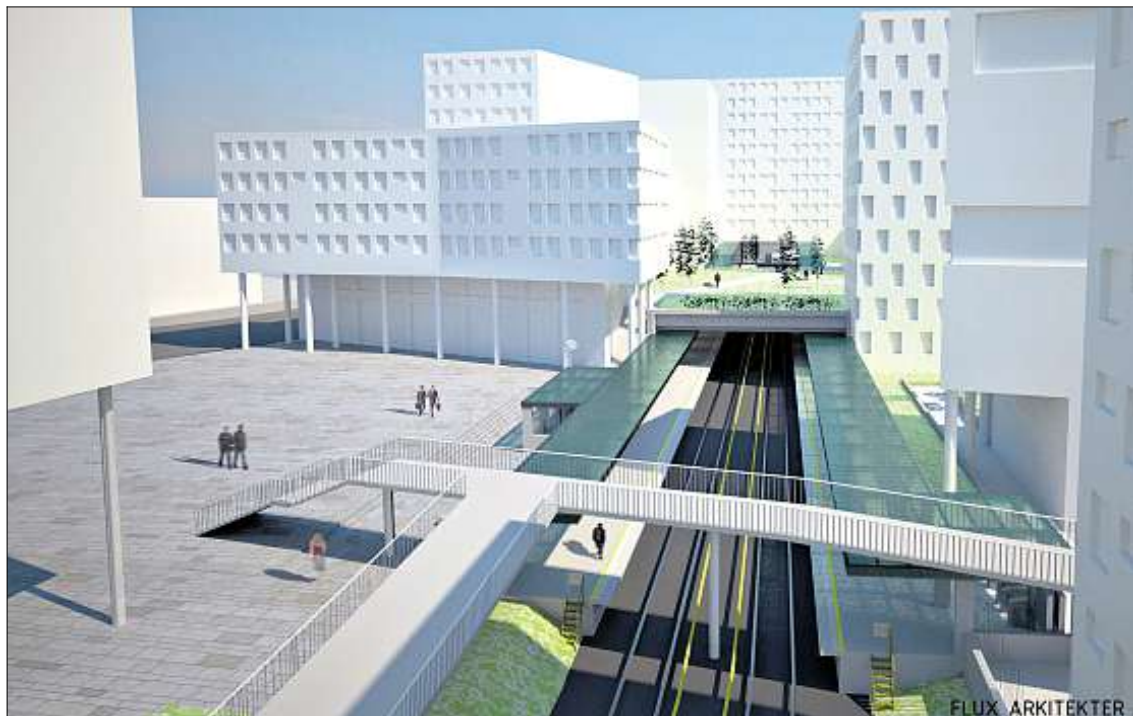
Slik vil Ensjø T-banestasjon se ut fra høsten 2012.

Aftens lokalsider kommer ut hver onsdag. Vi følger nærmiljøet tett, og vil gjerne ha tips om det du mener er viktig å fortelle om fra stedet der du bor.